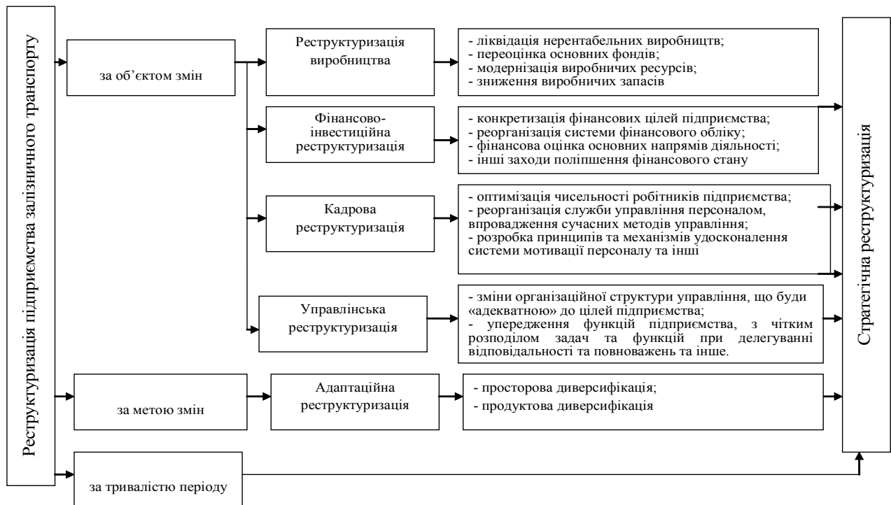
Рис. 1. Визначення виду реструктуризації на підприємствах залізничного транспорту

Задля забезпечення ефективної реалізації реструктуризації структурних підприємств вагонного господарства залізничного транспорту, механізм її реалізації має складатися з наступних етапів проведення структурних змін: