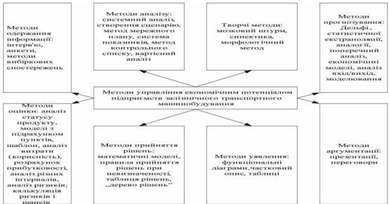
Рис. 1. Класифікація методів управління економічним потенціалом підприємств

Автором доведено, що економічний потенціал, який поєднує в собі як просторові, так і часові характеристики, концентрує увагу одночасно на трьох типах зв'язків і відносин, а саме: відображає минуле, тобто сукупність властивостей, накопичених системою в процесі її становлення та тих, що визначають можливість її функціонування і подальшого розвитку; характеризує рівень практичного застосування та використання наявних можливостей; орієнтується на розвиток.