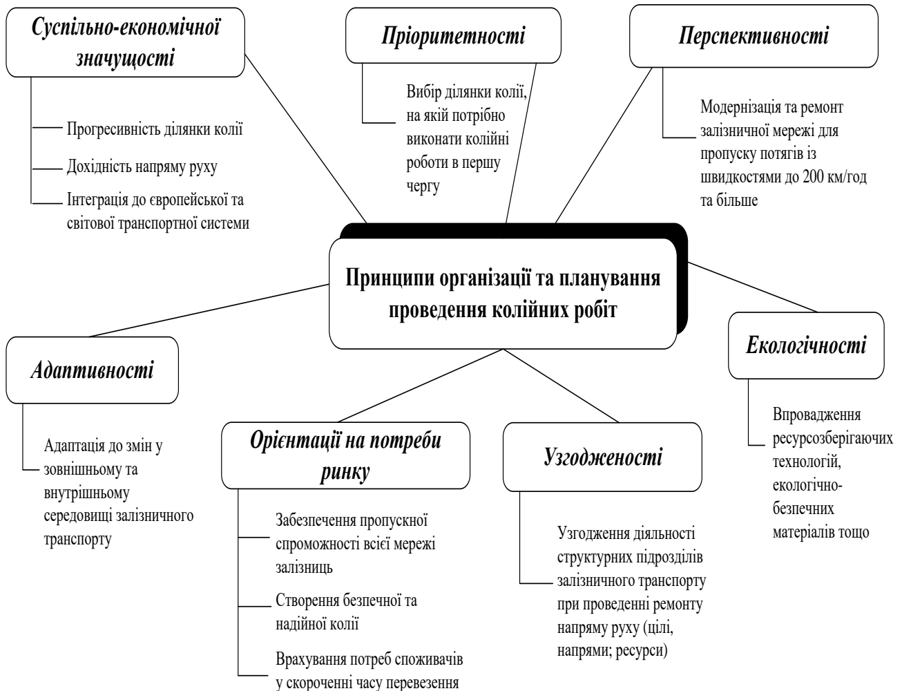
Рис. 2. Основні принципи управління підприємствами колійного господарства в сучасних умовах

перспективності, адаптивності, «ощадливого виробництва», постійного удосконалення та ін. для створення необхідних умов ефективного, надійного і безпечного розвитку галузі. На рис. 2 подано основні принципи організації та планування ведення колійних робіт підприємствами колійного господарства.