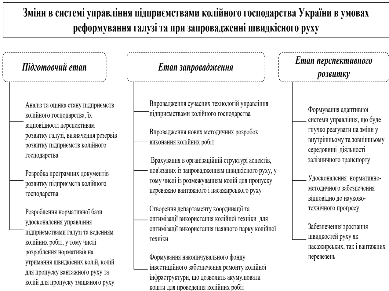
Рис. 3. Напрями реформування підприємств колійного господарства

Обґрунтовано, що при реформуванні залізничного транспорту та при зміні форми власності галузі потрібні зміни і в організації управління підприємствами колійного господарства, спрямовані на адаптацію функціонування підприємств колійного господарства до зовнішнього та внутрішнього середовища (рис. 3).