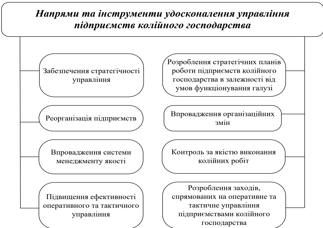
Рис. 1. Напрями та інструменти, спрямовані на удосконалення управління підприємствами колійного господарства

У дисертаційному дослідженні зазначено, що управління підприємствами колійного господарства має базуватися на загальних принципах управління, враховуючи зміни у роботі служб колій, дистанцій колій, колійно-машинних станцій та інших структурних підрозділів господарства, у зв'язку із реорганізацією галузі, запровадженням швидкісного руху, зміною основних напрямів вантажо- та пасажиропотоків, розділенням колій для пропуску переважно вантажного і пасажирського рухів тощо (рис. 1.)