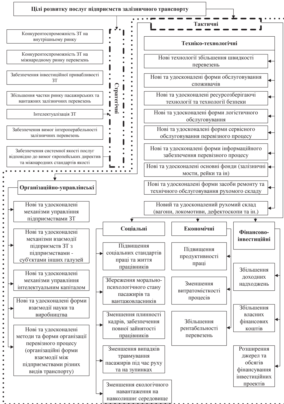
Рис. 2. Класифікація цілей розвитку послуг підприємств залізничного транспорту (авторська розробка)

Визначаючи першочергову роль маркетингової діяльності в справі удосконалення та розвитку транспортних послуг, В.М. Борщ пропонує в якості факторів визначати такі, які впливають на просування