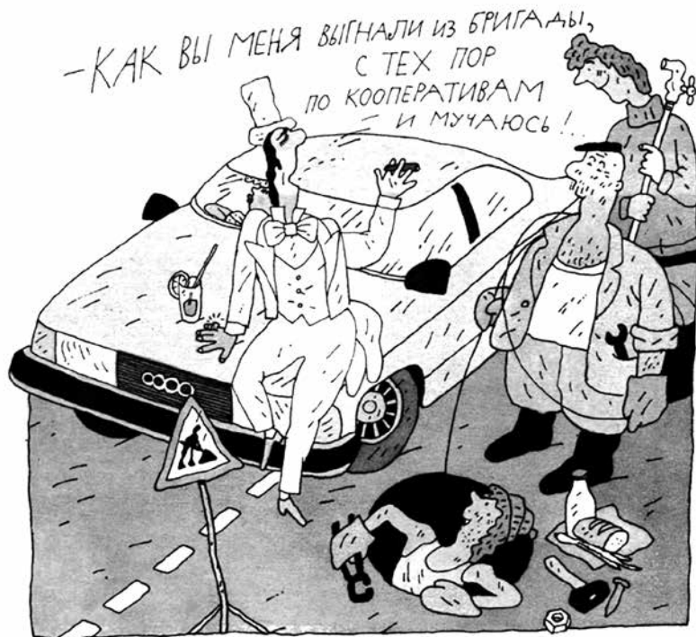
Рисунок В. ДМИТРИЮКА.