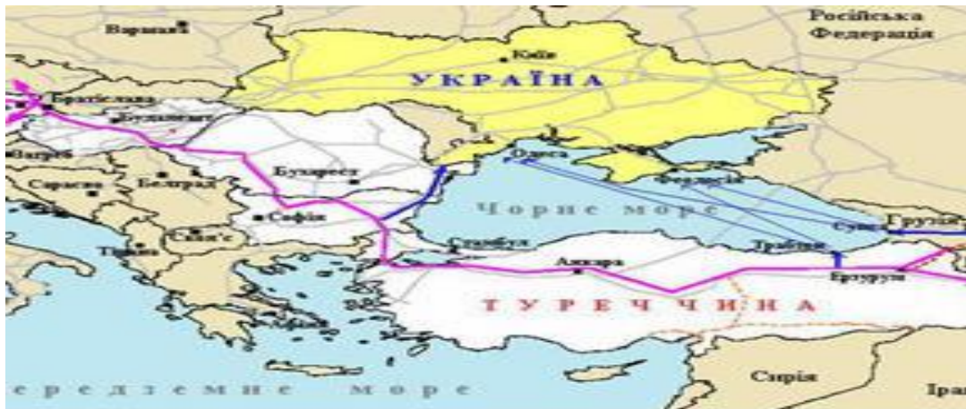
Рисунок 2 – Маршрут газопроводу Набукко

З метою покращення транзитного іміджу України необхідно особливу увагу приділити розбудові на території нашої держави мережі МТК, оскільки їх розвиток має для країни геостратегічне значення.