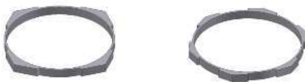
Рис. 3. Загальний вигляд рухомих кілець з чотирма і шістьма виступами

Загальний вигляд рухомих кілець з різною кількістю виступів, що створюють з гладким нерухомим кільцем конфузотно-дифузотні канали, показано на рис. 3.